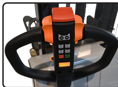
Samtliga modeller är utrustade med pinkodsläs.