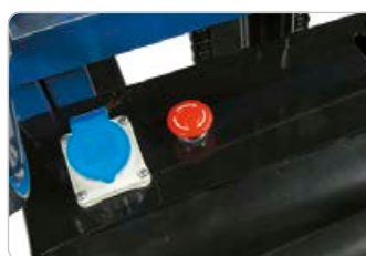
Ladestik / Nødstop