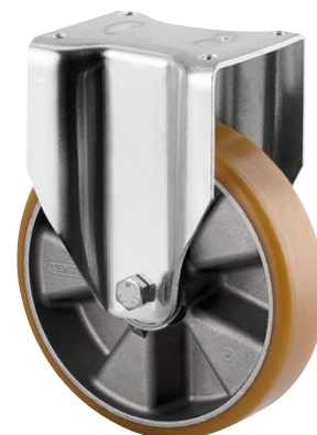
Billedet kan afvige fra originalt produkt