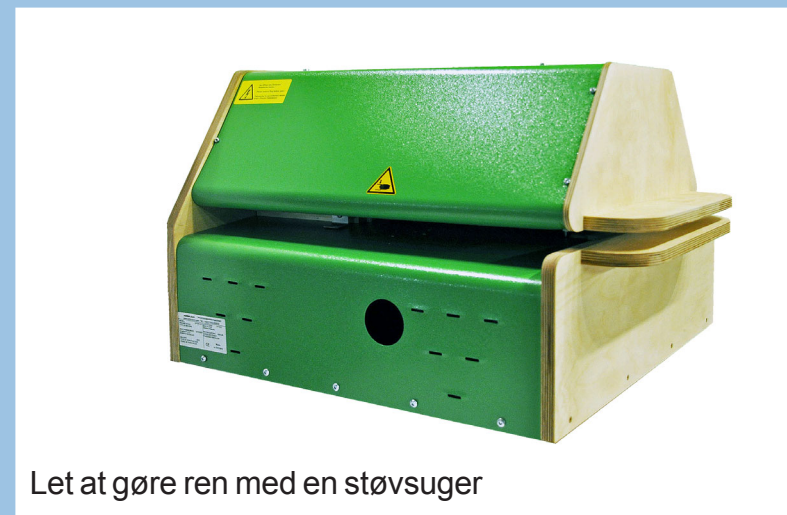
Let at gøre ren med en støvsuger