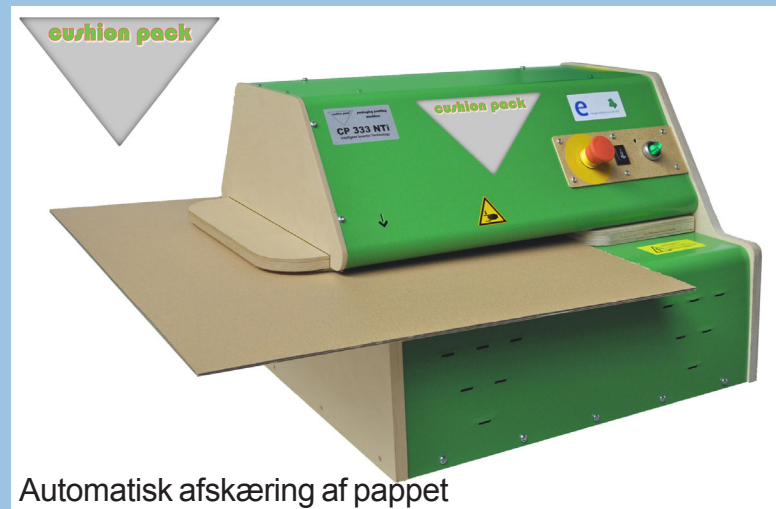
Automatisk afskæring af papret

For eksempel er chassiset af CP 333 NTi fremstillet af 70% bæredygtige råmaterialer (lamineret bord - krydsfiner og MDF plader), og maskinen er fremstillet udelukkende med vedvarende energimaterialer.