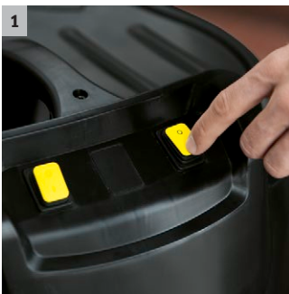
1 2 motorer

Kraftfuld våd-/tørsuger med 70 l beholder og op til tre motorer.