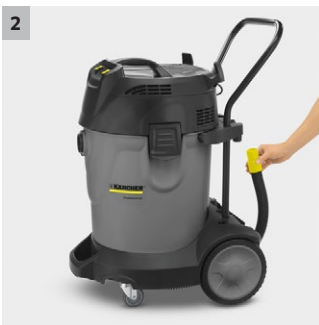
2 Nem at bruge