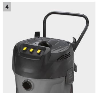
4 Ergonomisk håndtag